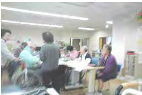
ある月の練習風景