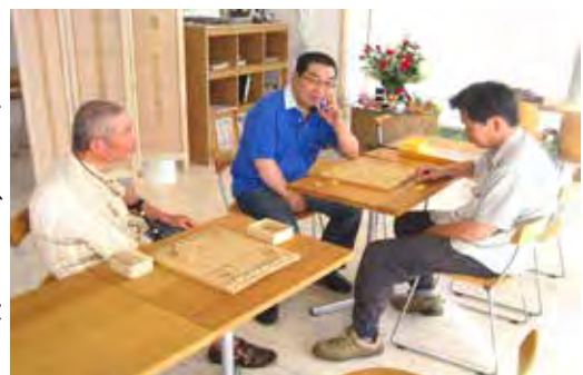
毎回集まっても4名です