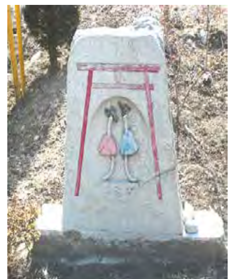
蚯蚓神社の祭壇のカット石碑