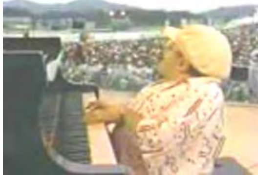
野外の会場で演奏会で演奏する