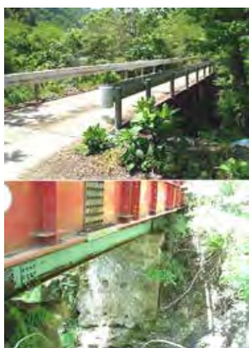
善白鉄道についてのカット(2)