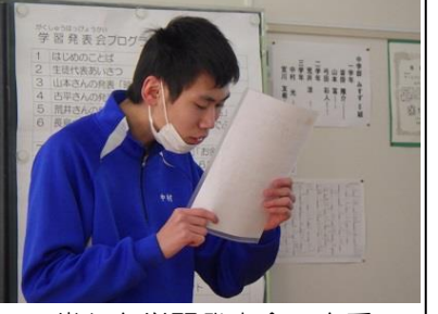
堂々と学習発表会の本番