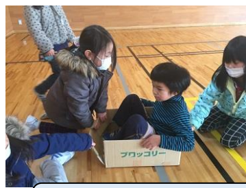
それぞれの居住地校との交流（栗ガ丘小、森上小、日野小、日滝小）