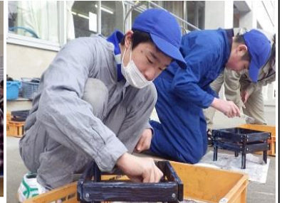
作業学習「鉄力バー」の制作