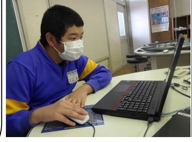
パソコンクラブで調べ学習に集中