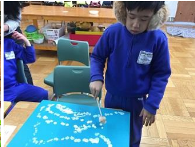
水彩絵の具で絵を描きました