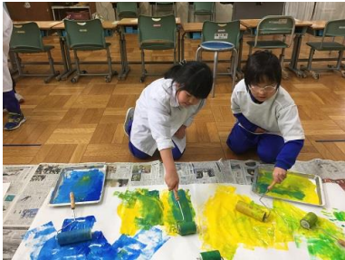
協力して学習発表会の背景作り