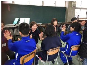
音楽で土笛の会の皆さんと

居住地校の同学年や特別支援学級の友達との交流、須坂小の友達や先生方、土笛の会の皆さんとの交流など、短い3学期の中でも様々な交流学習が行われました。