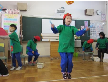
学習の成果を元気に発表

今年度もいよいよ締めくくりの時期を迎えました。支援学校ではこの時期「冬の遊び」「学習発表会」「学習のまとめ」の3つのテーマで生活単元学習が展開されました。スキー教室に向けて、屋外で元気に体を動かしたり、室内でも友達とルールを決めて遊んだりして、この時期ならではの楽しい思い出を作りました。またこれまでの活動の中で特にならできたことや得意になったことなどを参観日に発表しようと、その練習にも精一杯取り組みました。そして今は卒業式や新年度に向けての準備を始めています。卒業生の門出をお祝いし、合わせてそれぞれに進級する気持ちを大切にしながら、新たな生活に向けて進んでいきたいと思ひます。